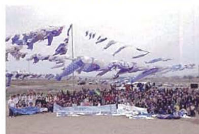
◎May 5, 2015 Boy's Day Celebration