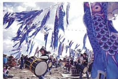
◎May 5, 2011 Boy's Day Celebration