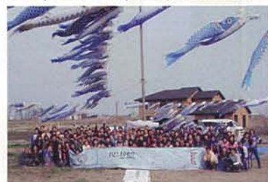
◎May 5, 2013 Boy's Day Celebration