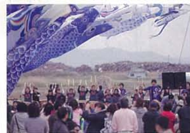
◎May 5, 2014 Boy's Day Celebration