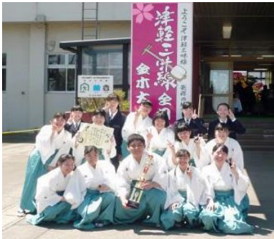
第31回 津軽三味線全日本金木大会 優勝