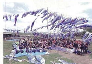
◎May 5, 2016 Boy's Day Celebration