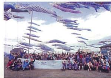
◎May 5, 2012 Boy's Day Celebration