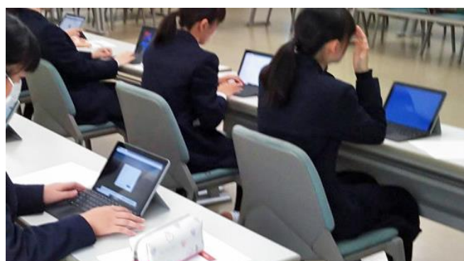
タブレットパソコン SurfaceGo 授業利用風景