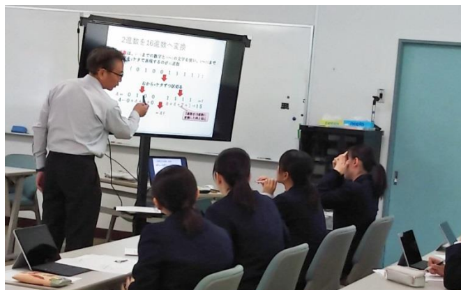
電子黒板（てれたち）授業利用風景