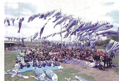
◎May 5,2016 Boy's Day Celebration