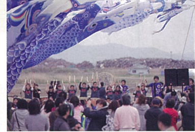
◎May 5,2014 Boy's Day Celebration