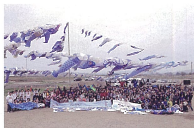
◎May 5,2015 Boy's Day Celebration