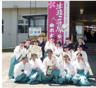
第31回 津軽三味線全日本金木大会 優勝