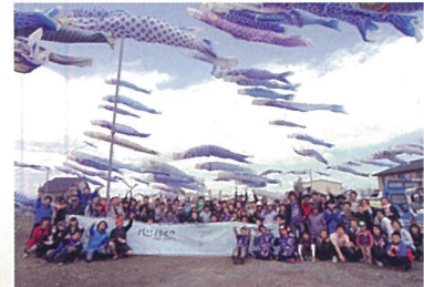
◎May 5,2012 Boy's Day Celebration