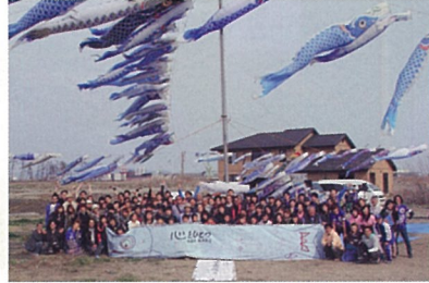
◎May 5,2013 Boy's Day Celebration