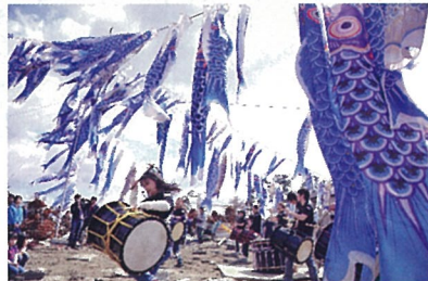
◎May 5,2011 Boy's Day Celebration