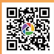
公式ホームページ