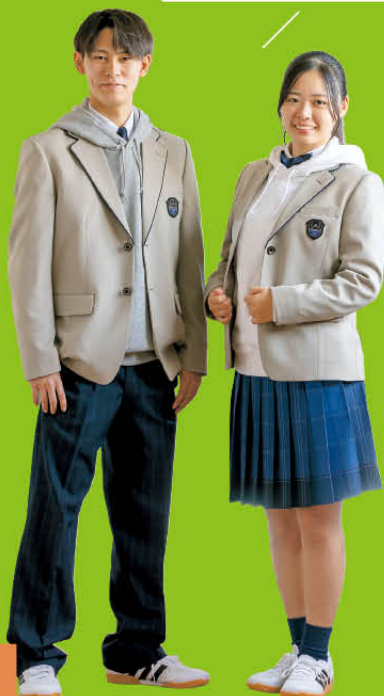
ブレザー・パーカー